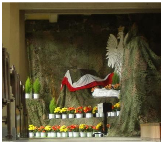
Grób Boży w kościele garnizonowym w Gliwicach - zdjęcie 28 IV 2011 r.

Rok 2016 - Rok Henryka Sienkiewicza, Rok Feliksa Nowowiejskiego, Rok Cichociemnych Narodowy Dzień Pamięci „Żołnierzy Wyklętych” – 1 marca 24 III – Narodowy Dzień Życia, 25 III – Dzień Świętości Życia