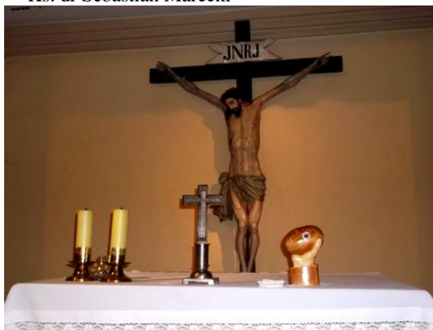
Relikwie św. Brata Alberta na ołtarzu