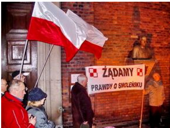
Przed kościołem garnizonowym w Gliwicach po Mszy św. w kościele - 10 III 2011 r.