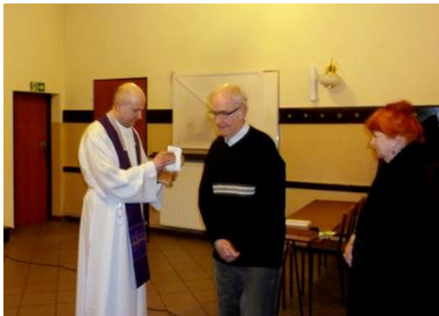
Oddanie czci relikwiom św. Brata Alberta