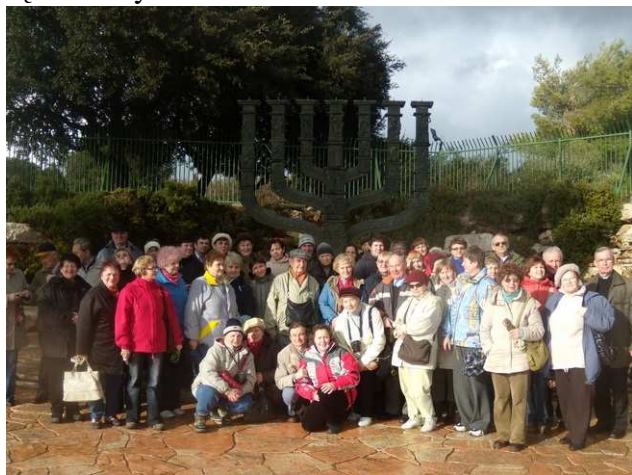
W pobliżu Jad Waszem

Poniższe zdjęcie obrazuje pielgrzymów uczestników pielgrzymki życia do miejsc początków wiary chrześcijańskiej. Miejsc, w których Jezus Chrystus urodził się, żył, nauczał, umarł w męczeństwie, zmartwychpowstał i wstąpił do Nieba. Miejsca, które daje nam wiarę i sens życia.