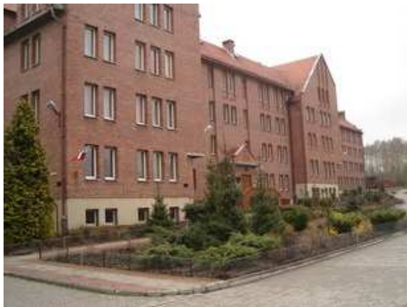
Parafia Matki Boskiej Kochawieckiej w Gliwicach - 12 IV 2010 r.