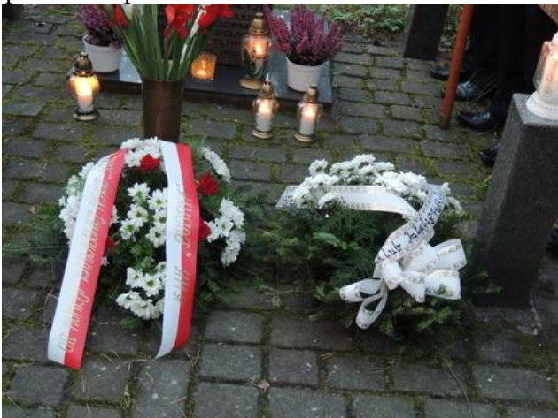
Kwiaty od NSZZ „Solidarność” KWK „Budryk” i Klubu Inteligencji Katolickiej w Katowicach.