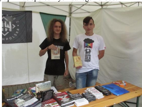
Stoisko Młodzieży Wszechpolskiej – książki „DYKTATOR Romuald Traugutt” i „Tomasz z Akwinu” są z naszego stoiska.

„Czym jest polski nacjonalizm? Nacjonalizm jest to ogół polskich nurtów myśli narodowej i związanych z nimi ruchów społecznych, kulturowych oraz politycznych, który w obecnej formie skryształizował się w I poł. XX wieku. Celem polskich nurtów nacjonalizmu jest zachowanie polskiej kultury oraz struktury etnicznej narodu, a także utworzenia opartego na nich niepodległego państwa polskiego. Krótko mówiąc, nacjonalizm to postawa społeczno-polityczna, która uznaje naród za najwyższe dobro w sferze życia oraz polityki. Głosi solidarność wszystkich grup i klas społecznych danego narodu.”