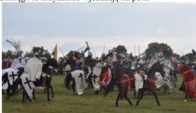
Starcie oddziałów konnych.