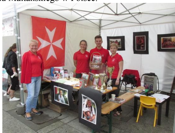
Dyżurujący na stoisku Zakonu Maltańskiego.

Naprzeciw naszego stoiska było stoisko Zakonu Maltańskiego w Polsce.