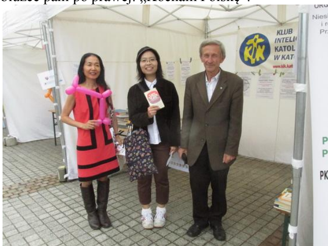
Japonki znalazły u nas coś dla siebie – książkę „LIFE AFTER LIFE”.

Dwa stoiska dalej było stoisko Młodzieży Wszechpolskiej. Po długim przeglądaniu osoby z obsługi stoiska wzięły od nas kilka książek.