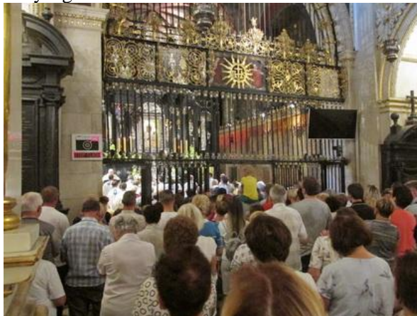
Msza św. w kaplicy Cudownego Obrazu.