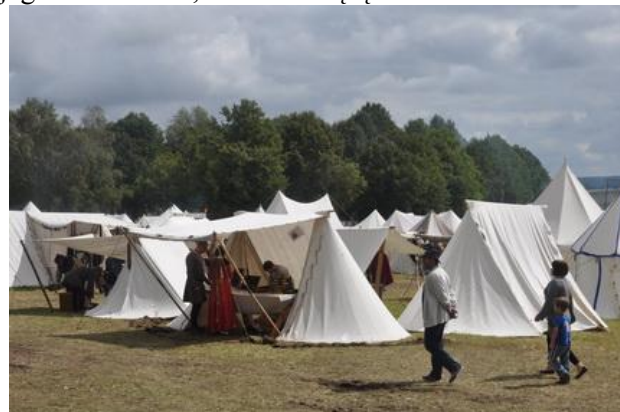
Widok na obóz rzemieślniczy (fragment).