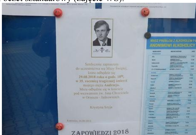
Informacja o uroczystości na tablicy ogłoszeń.