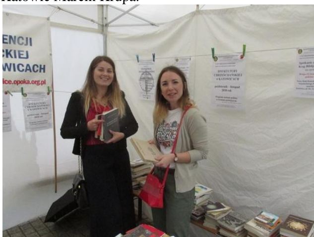
Młodzież jest zainteresowana książkami – napis na bluzce pani po prawej: „Kocham Polskę”.