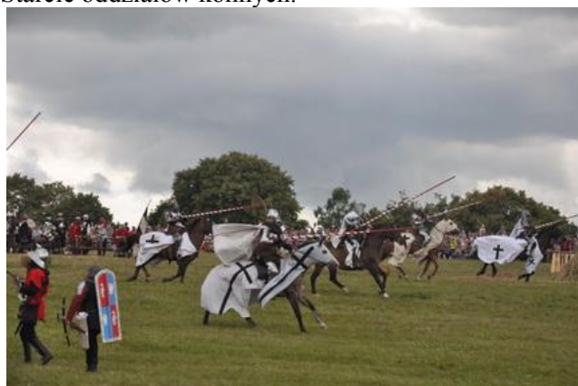
Rycerze kopijnicy w natarciu.

Szukając informacji o wydarzeniu, dowiadujemy się, że lipcowa inscenizacja bitwy pod Grunwaldem jest największym tego typu wydarzeniem