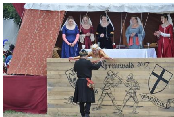
Fragment placu turniejowego (wręczenie nagród).