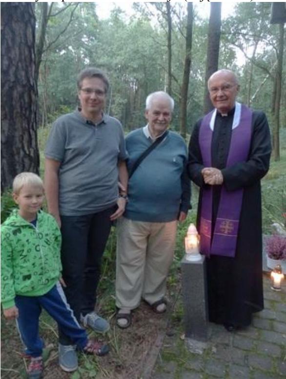
Trzy pokolenia rodziny Salów z ks. Stanisławem.