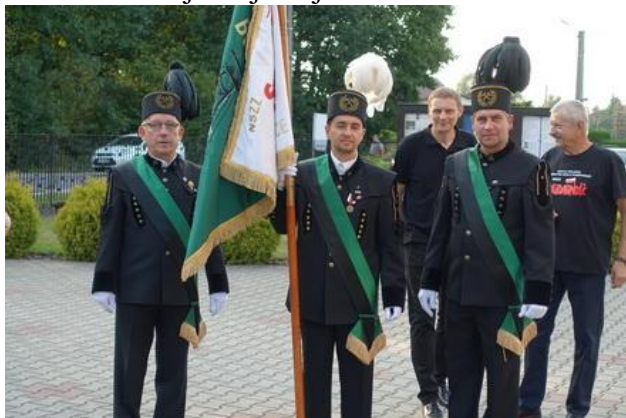
Poczet sztandarowy.

W 35 rocznicę śmierci, jak co roku od wielu lat, zgromadziła się w Jaśkowicach rodzina, przyjaciele z „Solidarności”, Duszpasterstwa Akademickiego, Klubu Inteligencji Katolickiej w Katowicach i wiele innych osób. Był poczet sztandarowy NSZZ „Solidarność” KWK Budryk, przedstawiciele sekcji krajowej.