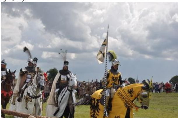
Chorągwie krzyżackie wjeżdżają na pole.