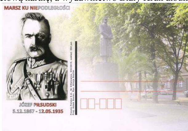
Okolicznościowa kartka pocztowa z widokiem na Pomnik Józefa Piłsudskiego w Gliwicach.

W tym roku Poczta Polska wydała okolicznościową kartkę, a wydawnictwo Biały Kruk album.