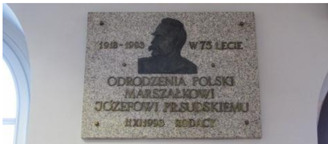
Tablica pamiątkowa na dworcu kolejowym w Pszczynie. 1918 – 1993 W 75 LECIE ODRODZENIA POLSKI MARSZAŁKOWI JÓZEFOWI PIŁSUDSKIEMU 11 XI 1993 RODACY