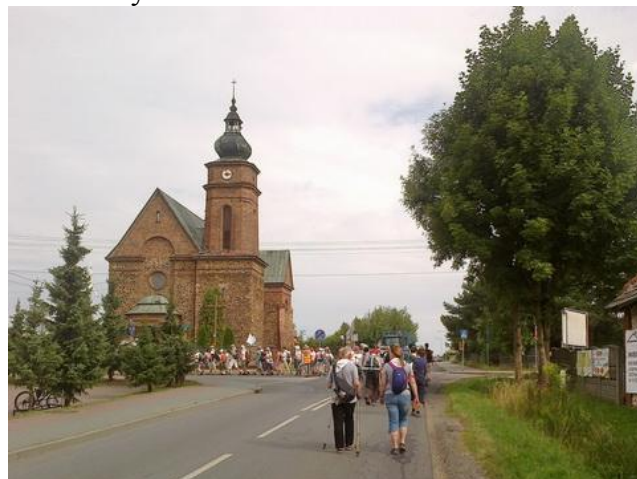
Starcza. Kościół Najświętszej Maryi Panny Częstochowskiej.

Drugi dzień pielgrzymki rozpoczęliśmy Mszą św. przed cudownym wizerunkiem Matki Bożej Piekarskiej. Dołączyła się do nas 10-osobowa grupa ze Świętochłowic. Razem pomaszzerowaliśmy przez Świerklaniec, Bibielę i Dąbrowę Wielką do Woźnik. Ostatni odcinek był uciążliwy ze względu na budowę autostrady i nałożenie dodatkowych trzech kilometrów.