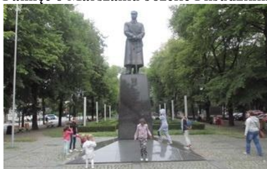
Pomnik Józefa Piłsudskiego w Gliwicach – odsłonięty 11 listopada 1998 roku.