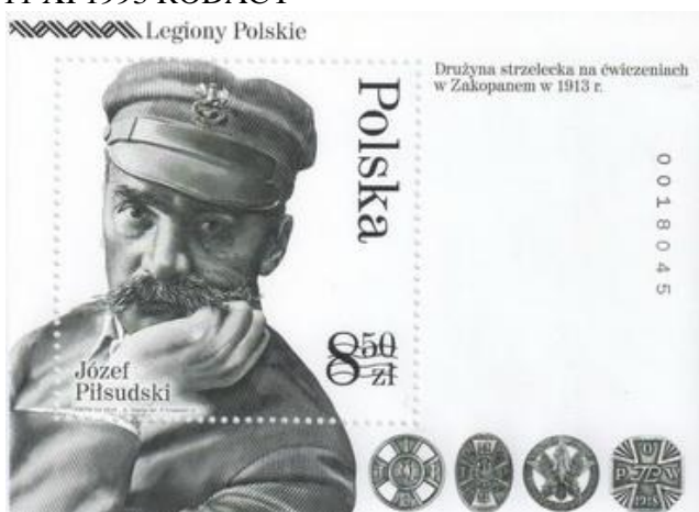
Znaczek Poczty Polskiej - 2014 rok.

W tym roku Poczta Polska wydała okolicznościową kartkę, a wydawnictwo Biały Kruk album.