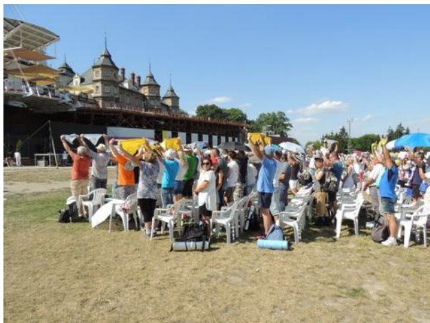
Jasna Góra. Msza św.

Link do zdjęć z pielgrzymki jest w Kronice Klubu pod datą 2-5.08.2017: