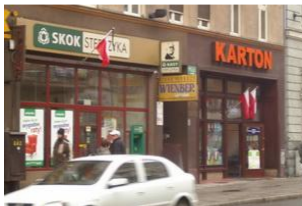
Ulica Zwycięstwa w Gliwicach - 14 IV 2010 r.