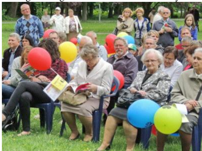
W Parku Kościuszki.