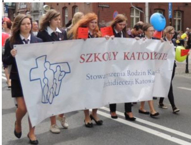
Szkoły katolickie wzięły udział w Marszu.

Marsz, którego hasłem było „Rodzina Obywatelska. Rodzina, wspólnota, samorząd” wpisali się w Metropolitalne Święto Rodziny i był jednym z ponad 130 marszów w Polsce.