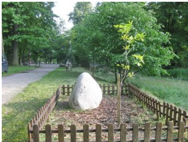
Dąb ks. Herberta Hlubka rośnie – 31 V 2014

Emilian Kocot: Bardziej być czy bardziej mieć..., nr 32/2001.