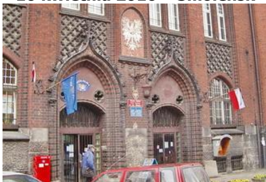
Poczta Polska Urząd Pocztowy 44-100 Gliwice 1 - 14 IV 2010 r.