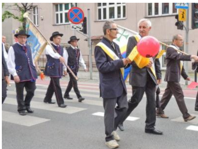
Członkowie Związku Górnośląskiego w strojach śląskich.