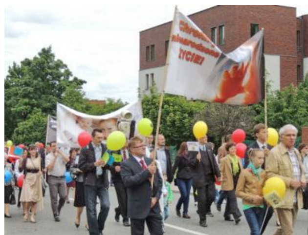
"Chrońmy nienarodzone życie".